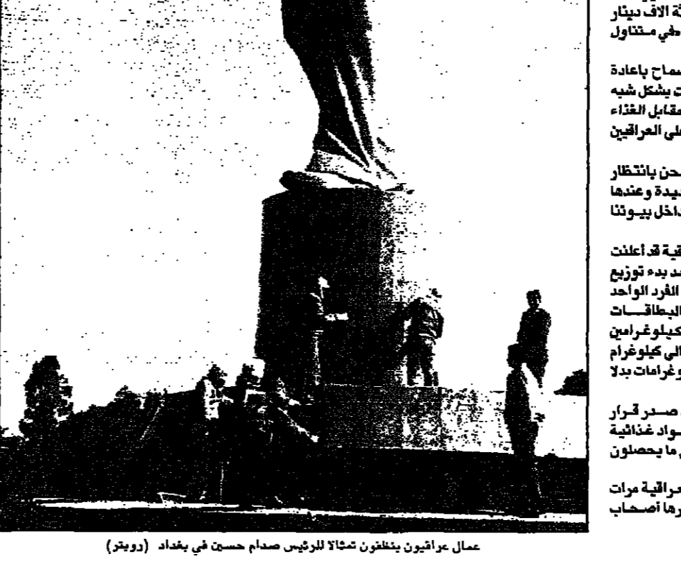
علاء عرواحين يتلفن شمالا للرئيس صدام حسين في بغداد

الكويت - ا ف ب: طلب 16 نائبا كويتيا مساء الثلاثاء من الحكومة فتح نقاش، حول عقد لشراء صواريخ بحري بحجم بقيمة 90 مليون دولار من شركة بريتش ايروسبيس البريطانية التي كانت تتنافس مع شركة «ايروسبيال» الفرنسية حول هذه الصفقة.